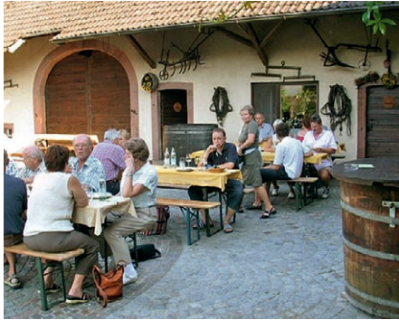
Im Hof herrscht Hochbetrieb.

Hunn daraus, dass inzwischen rund 80 Prozent der Reben maschinell mit einem Vollernter gelesen werden. „Seit wir das so machen, haben wir noch bessere Weine“, ist sie überzeugt. Das Lesegut stehe nicht mehr so lange und unnötigerweise in den Weinbergen herum. Die Weine seien dadurch auch reiner und einfach besser. Im Keller sei die Devise „so wenig wie möglich und so viel wie nötig“. Dabei werde das Handeln auf das komplexe