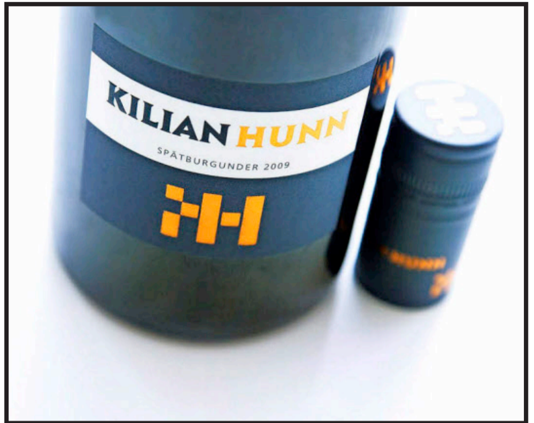
Ein Roter, den man im Sommer auch etwa kühler trinken kann.

Hunn teilt seine Weine in „Junge Frische“, „Junge Wilde“, „Spätburgunder Rotwein“ und „Selektion“ ein, wobei er zwischen Qualitätswein und Kabinett unterscheidet. Seine jungen Frischen sind Rivaner, Weißer Burgunder, Grauburgunder und Spätburgunder Rosé, die alle im Edelstahltank angebaut werden. Sie werden in der Flasche mit Schraubverschluss verkauft und zeichnen sich durch Frische, Leichtigkeit und Eleganz aus. Der 2012 Spätburgunder Rosé Kabinett Trocken mit seinen frischen Duftnoten von Sauerkirschen und Roten Beeren sowie seinem pikant würzigen Geschmack nach roten Johannisbeeren eignet sich hervorragend für die asiatische Hochküche. So ist es nicht verwunderlich, dass Hunns Weine in Seoul, Peking und Lanzhou bestens ver-